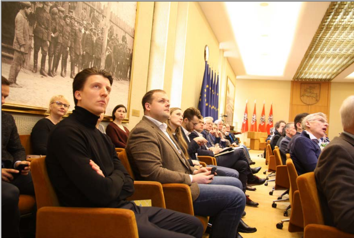
Konferencijos akimirkos.

LIETUVOS VARTOTOJŲ ORGANIZACIJŲ ALJANSAS